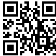
Şekil 1: Sınav Yeri Adresi Kare Kodu

Süleyman Demirel Üniversitesi Spor Bilimleri Fakültesi Özel Yetenek Sınavları Süleyman Demirel Üniversitesi Spor Bilimleri Fakültesi Atatürk Spor Salonunda Doğu Yerleşkesi, Çünür/Isparta’ da yapılacaktır.